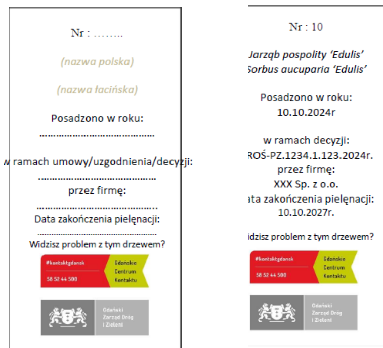
Fot. nr 1 – zdjęcie poglądowe oznakowania nasadzeń

Na tabliczce należy również umieścić nr porządkowy drzewa lub oznaczenie zgodne z dokumentacją projektową